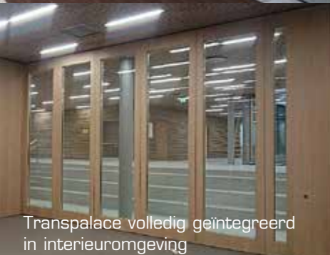
Transpalace volledig geïntegreerd in interieuromgeving