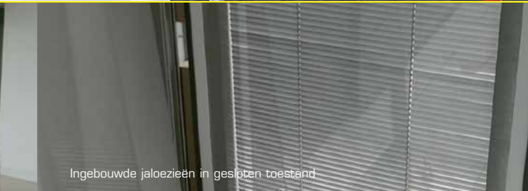
Ingebouwde jaloeziën in gesloten toestand