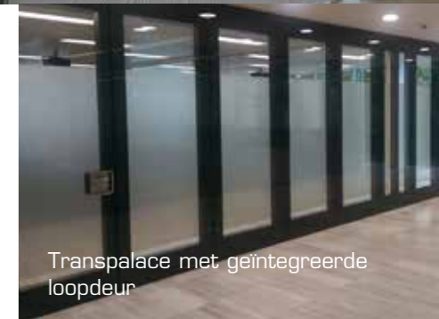
Transpalace met geïntegreerde loopdeur

Dit zorgt voor een dynamische uitstraling waar privacy en transparantie hand in hand gaan. Hiernaast kunnen foliën en beletteringen aan de binnenzijde van het glas worden aangebracht waardoor extra duurzame functionaliteiten aan de mobiele glazenwand kunnen worden toegevoegd.