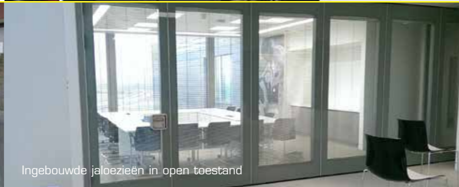
Ingebouwde jaloeziën in open toestand