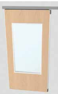
Panneau avec oculus en verre