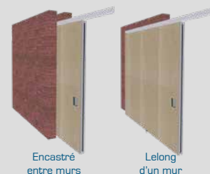
Cloison coulissante Palace XXL

Autres versions et dimensions sur demande. Votre distributeur Parthos sera heureux de vous fournir toutes informations techniques détaillées.