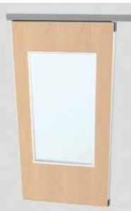
Panneau avec oculus en verre