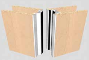
Palace 110 S