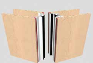
Palace 110SI EI30 mit innenliegenden Profilen