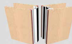
Palace 110SI EI60 mit innenliegenden Profilen