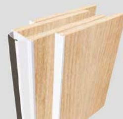
Teleskop mit Kantenschutzprofil