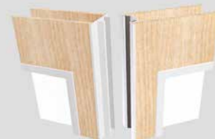
Transpalace 80 mit Einfachverglasung / geeignet für den Außenbereich