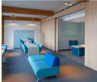
PALACE XXL SCHUIFWAND